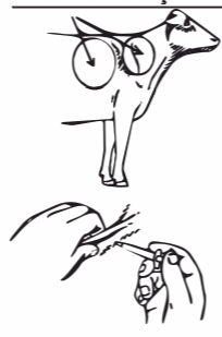
Tábua do Pescoço & Atrás da Paleta

Pince e eleve a pele com os dedos e injete entre a pele e o músculo